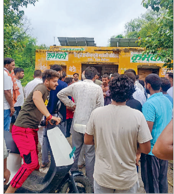
सोनीपत। केंद्र के बाहर इकट्ठा हुए किसान।