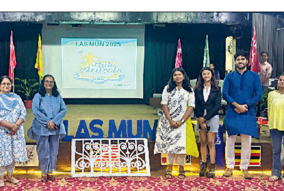
सोनीपत। कार्यक्रम के दौरान अतिथियों के साथ लिटल एंजल्स विद्यालय की प्राचार्या, स्टाफ एवं अन्य।