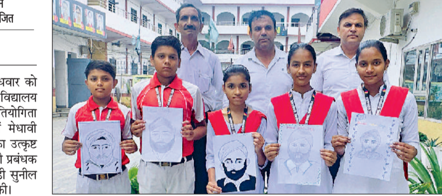
गोहाना। अपने द्वारा तैयार किए बायोस्केच प्रदर्शित करते हुए विद्यार्थी।