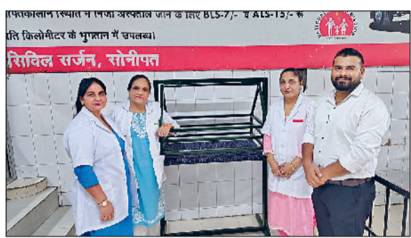
सोनीपत। आपातकालीन कक्ष के बाहर रखा झूला व मौजूद स्टाफ कर्मी।

जिला स्वास्थ्य विभाग ने नवजात शिशुओं की सुरक्षा सुनिश्चित करने के लिए 'पालना झूला योजना' की शुरुआत की है। इस योजना के तहत अब वे माता-पिता या अभिभावक जो किसी भी कारणवश नवजात शिशु की परवरिश नहीं कर सकते, वे उसे बिना अपनी पहचान जाहिर किए नागरिक अस्पताल में सुरक्षित स्थान पर छोड़ सकते हैं। आपातकालीन कक्ष के बाहर प्रबंधन की तरफ से झूला रखा गया है। कक्ष में तैनात स्टाफ कर्मचारियों को इस संबंध में निगरानी रखने के निर्देश दिए गए। ताकि कोई बच्चे को छोड़कर जाता है तो तुरंत बच्चे को झुले से लेकर आगामी कार्यवाही अमल में लाए। बता दें कि झूला नागरिक अस्पताल के आपातकालीन वार्ड के समीप स्थित मंदिर प्रांगण में स्थापित किया गया है। सिविल सर्जन डॉ. ज्योत्सना ने जानकारी देते हुए बताया कि झूले की जगह को पूर्णतः गोपनीय रखा गया है। वहीं कोई सीसीटीवी कैमरा नहीं लगाया गया, जिससे बच्चे को छोड़ने वाले व्यक्ति की पहचान उजागर न हो सके। उन्होंने बताया कि अक्सर कुछ लोग नवजातों को कूड़ेदान, रेलवे ट्रैक, सुनसान स्थानों या खेतों में छोड़ जाते हैं, जिससे उनकी जान को खतरा होता है। हाल ही में जिले में हुई घटनाएं इस गंभीर समस्या की ओर संकेत करती हैं। कई नवजातों की जान जा चुकी है। इस योजना के अंतर्गत नवजात को छोड़ने वालों से कोई पहचान या दस्तावेज नहीं मांगे जाएंगे। कोई कानूनी कार्रवाई नहीं की जाएगी। यह पूरी प्रक्रिया मानवीय