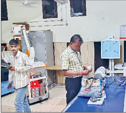
सोनीपत। मशीन को ठीक करते हुए कर्मचारी और चालू की गई मशीन पर मरीज का एक्सरे करते हुए।

जिले के नागरिक अस्पताल से मरीजों के लिए राहत की खबर सामने आई है। लंबे समय से खराब पड़ी एक्स-रे मशीन के कारण मरीजों को जांच के लिए निजी लैब्स का सहारा लेना पड़ रहा था। अब अस्पताल में नई अत्याधुनिक डिजिटल एक्स-रे मशीन को बुधवार से शुरू कर दिया गया है, जिससे न केवल आम मरीजों को, बल्कि विशेष शिविर में आए दिव्यांग बच्चों को भी बड़ी राहत मिली है। प्रबंधन की तरफ से पांच दिन से खराब पड़ी मशीन को भी ठीक करवा दिया। वहीं मंगलवार को खराब हुई एक अन्य पोटैबल मशीन को अभी कई दिन ठीक होने में लगेंगे।