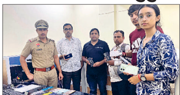
सोनीपत। मोबाइल मालिकों को फोन सौंपते हुए।