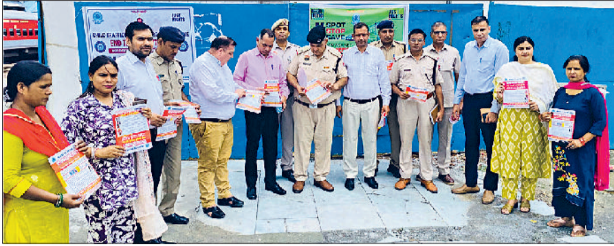
सोनीपत। कार्यक्रम के दौरान जागरूकता संबंधी पोस्टर के साथ अधिकारीगण।