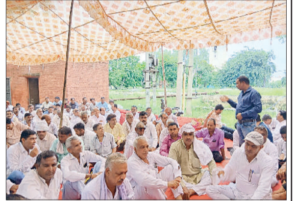
गन्जौर। आल हरियाणा पीडब्ल्यूडी मैकेनिकल कर्मचारी युनियन की बैठक में उपस्थित कर्मचारी।

संबंधित कर्मचारियों के खिलाफ कार्रवाई की मांग की है। उन्होंने चेतावनी दी कि यदि जल्द से जल्द खाद वितरण की पारदर्शी व्यवस्था नहीं की गई तो वे जिला मुख्यालय पर धरना प्रदर्शन करेंगे। इस मौके पर ग्रामीण किसान उपस्थित रहे, उन्होंने प्रशासन से मांग की कि