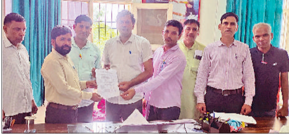
खंड शिक्षा अधिकारी को ज्ञान सौंपते शिक्षकगण।