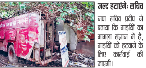
करवाई और न ही देखभाल की। अब हालात ये नया में आने वाले लोग भी उपेक्षा पर हैरानी जता रहे हैं। उनका

कहना है कि फायर ब्रिगेड जैसे आवश्यक सेवा के वाहन यदि उपयोग के लायक नहीं रह गए हैं, तो उन्हें कबाड़ घोषित कर हटाया जाना चाहिए। लापरवाही और अनदेखी के कारण सिर्फ एक बेकार जगह घेरने वाला ढांचा बनकर रह गए हैं। लोगों ने नगर पालिका से मांग की है कि इन वाहनों को तुरंत हटाने की प्रक्रिया शुरू करें, और यदि ये वाहन तकनीकी तौर पर फिर से उपयोग के योग्य नहीं हैं तो उन्हें नीलाम करके उससे प्राप्त राशि का उपयोग नगर की सफाई या जनहित योजनाओं में किया जाए।