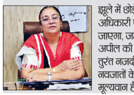
झूले में छोड़े गए नवजात को तुरंत चिकित्सकीय सुविधा दी जाएगी और फिर बाल संरक्षण अधिकारी एवं बाल कल्याण समिति को सूचित कर मान्यता प्राप्त बाल गृह में स्थानांतरित किया जाएगा।

झूले में छोड़े गए नवजात को तुरंत चिकित्सकीय सुविधा दी जाएगी और फिर बाल संरक्षण अधिकारी एवं बाल कल्याण समिति को सूचित कर मान्यता प्राप्त बाल गृह में स्थानांतरित किया जाएगा। जहां बच्चे की समुचित देखभाल, पोषण और शिक्षा की व्यवस्था की जाएगी। आमजन से अपील की है कि यदि उन्हें किसी नवजात को असुरक्षित स्थान पर छोड़े जाने की जानकारी मिले, तो तुरंत नजदीकी स्वास्थ्य केंद्र, पुलिस या बाल संरक्षण अधिकारी को सूचित करें। यह पहल न सिर्फ नवजातों के जीवन को बचाने का माध्यम है, बल्कि समाज को यह संदेश देती है कि हर जीवन मूल्यवान है और उसे जीने का अधिकार है।