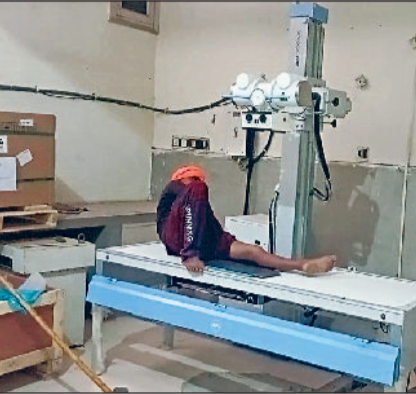
सोनीपत। मशीन को ठीक करते हुए कर्मचारी और चालू की गई मशीन पर मरीज का एक्सरे करते हुए।