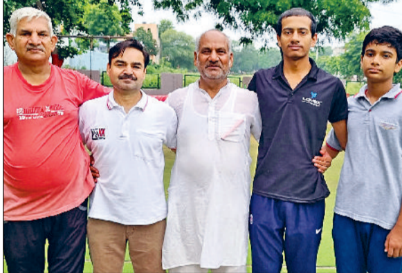
गोहाना। कार्यक्रम में मैत्रीपूर्ण व्यवहार के साथ वार्तालाप करते हुए नागरिक।